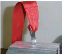
ブラケットの加工 写真はイメージです。